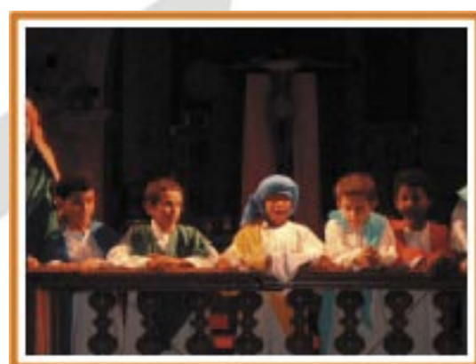
Imagens da Semana Santa em São Gonçalo do Bação