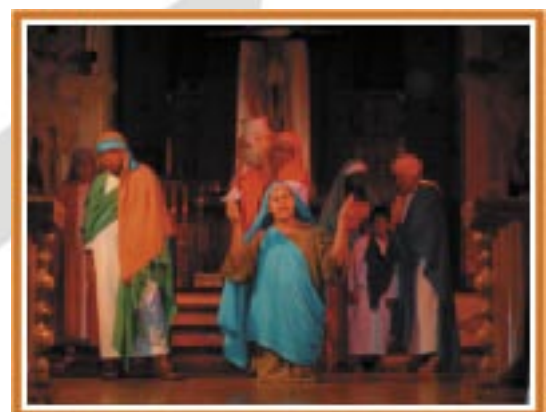
Imagens da Semana Santa em São Gonçalo do Bação