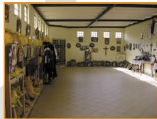
A sala de milagres