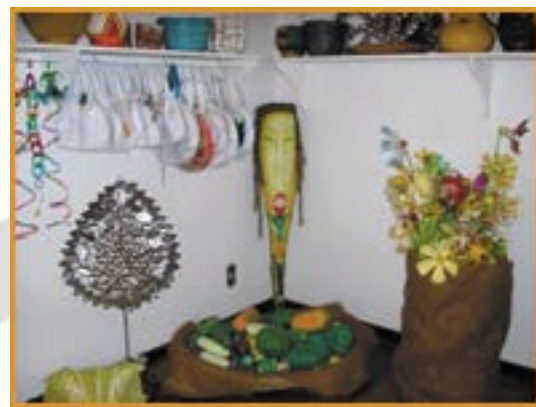
Artesanato com materiais recicláveis feito pelos jovens de Rocha Grande e que é vendido em feiras em Sabará, Belo Horizonte e Curitiba.

O Centro de Formação de Jovens oferece ainda cursos de balé, artesanato com materiais recicláveis e, recentemente, deu um curso técnico de Turismo aprovado pelo MEC, com ênfase na história de Rocha Grande, em que formou 17 jovens para atender os romeiros e turistas. O Centro também possui