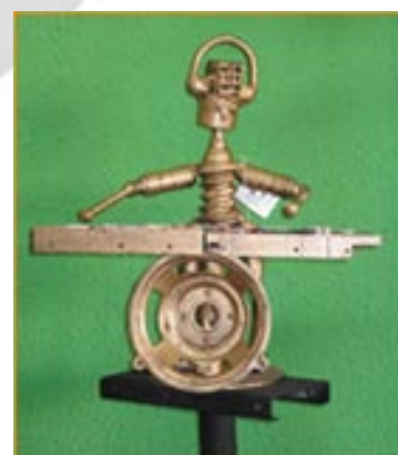
DJ com cabeça e braços articulados