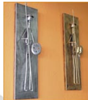
Dom Quixote em versões para parede