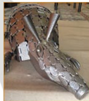
Tatu de um metro de comprimento, com casco feito de esteira industrial